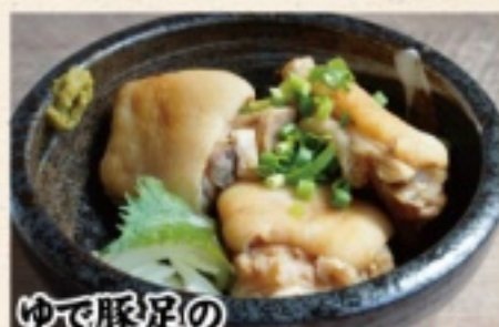
ゆで豚足の ポン酢和え