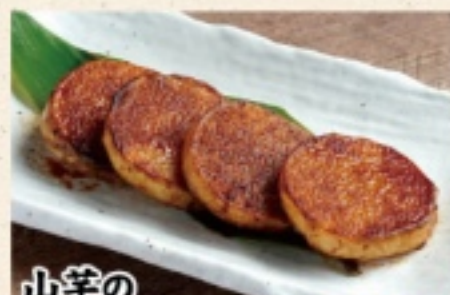
山羊の 九州醤油焼き