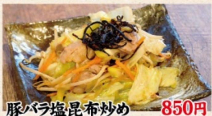
豚バラ塩昆布炒め