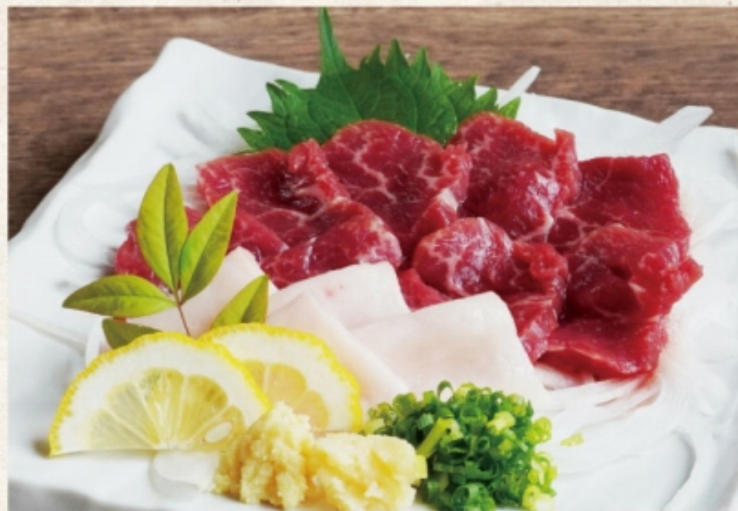
赤身とタテガミの 馬刺し盛り合わせ 3,480円