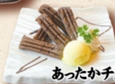
あったかチョコチュロス 580円