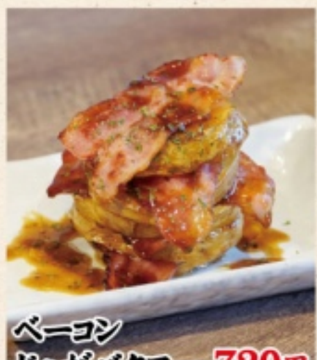
ベーコン ジャガバター