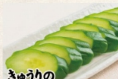
きゅうりの一本漬け 450円