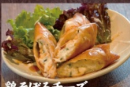
鶏そぼろチーズ 揚げ春巻き 780円