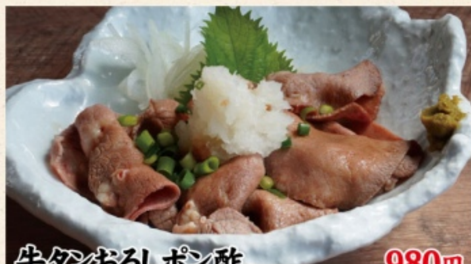
牛タンおろしポン酢