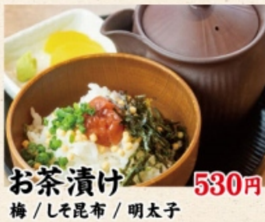
お茶漬け 530円 梅 / しそ昆布 / 明太子