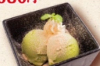
きなこ抹茶アイス 430円