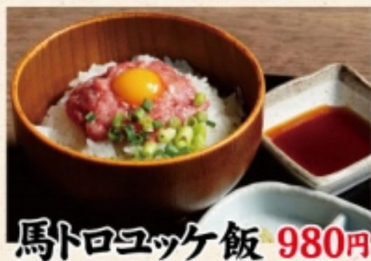
馬トロユッケ飯 980円