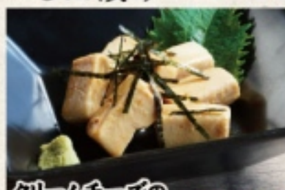
クリームチーズのニンニク醤油漬け 580円