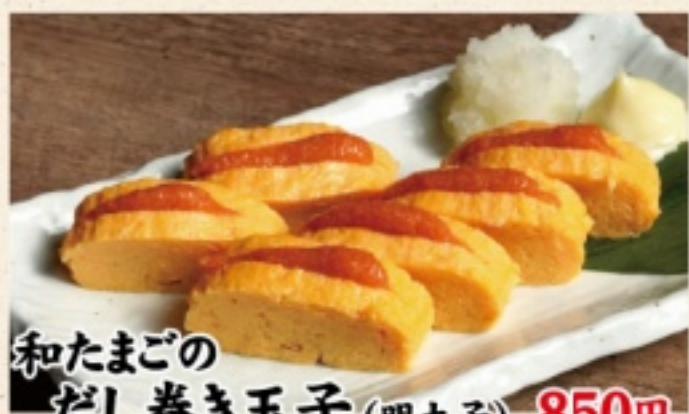
和たまごの だし巻き玉子 (明太子)