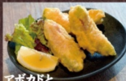
アボカドと 生ハムの天ぷら 780円