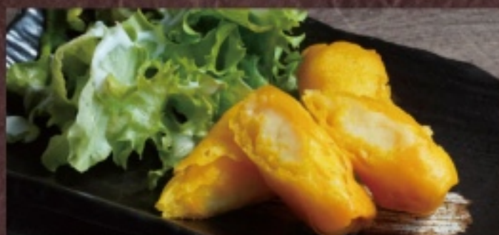
4種のチーズ揚げ 680円