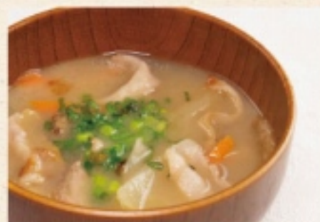
京風白味噌の豚汁 450円