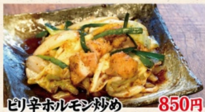
ピリ辛ホルモン炒め