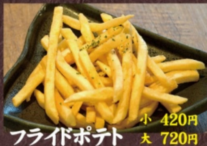
フライドポテト 小 420円 大 720円