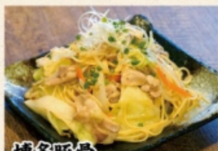
博多豚骨 焼きラーメン 950円