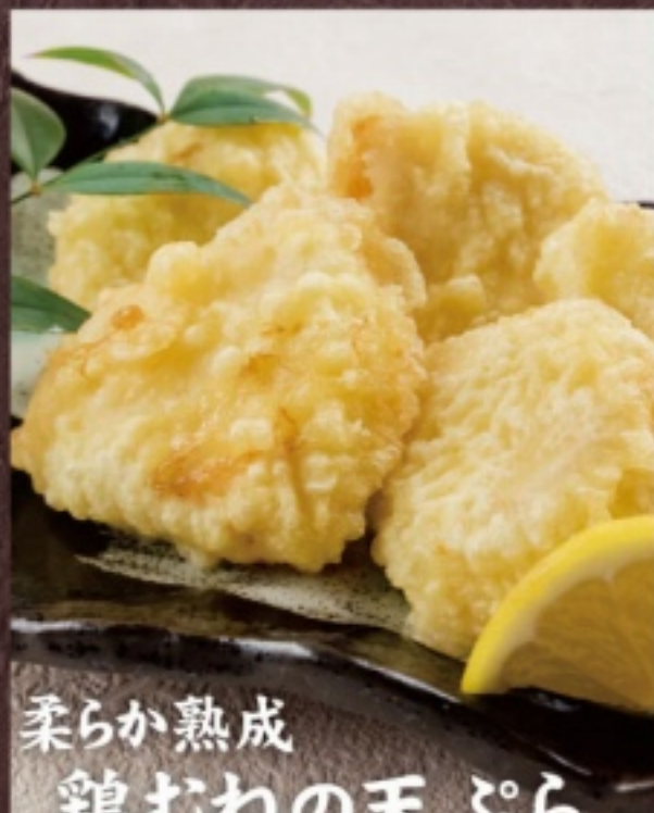
柔らか熟成 鶏むねの天ぷら 880円