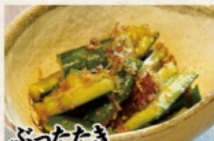
ぶったたききゅうり 480円