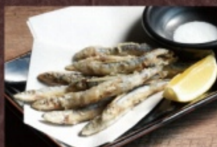
きびなごの唐揚げ 750円