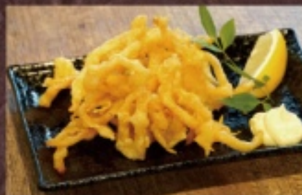
さきいかの天ぷら 620円