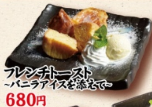
フレンチトースト ~バニラアイスを添えて~ 680円