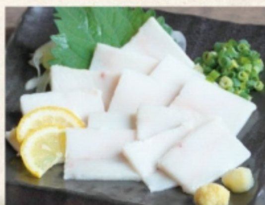
馬タテガミ刺し 1,980円