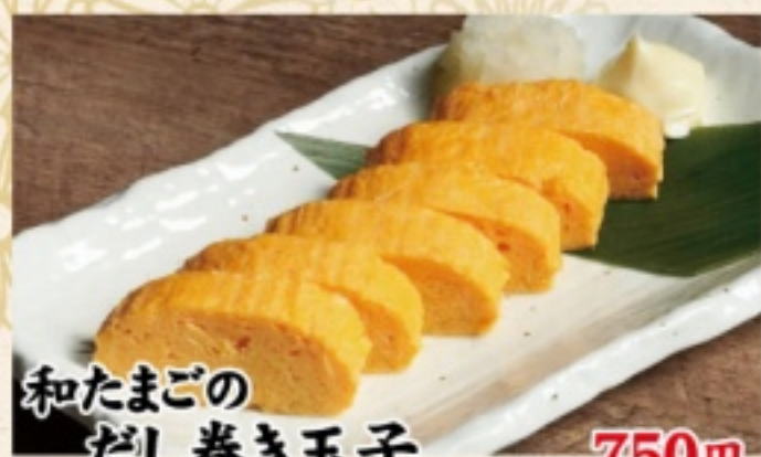
和たまごの だし巻き玉子