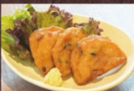
揚げたてさつま揚げ 750円