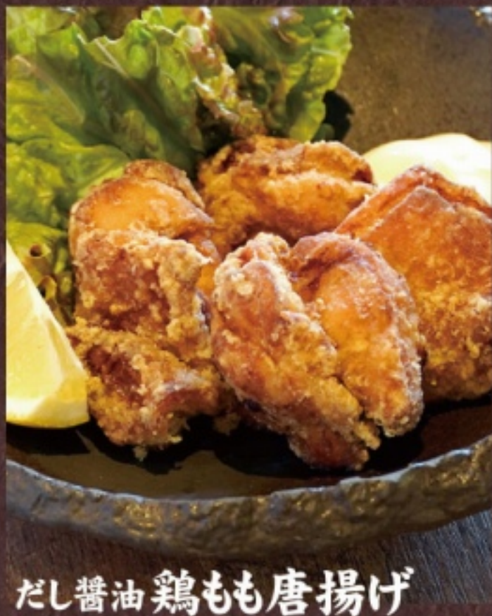
だし醤油鶏もも唐揚げ

ジューシーな唐揚げに、こだわりの甘酢とタルタルソース。 この味わいは定番にして最強。タルタルをたっぷり付けてどうぞ。