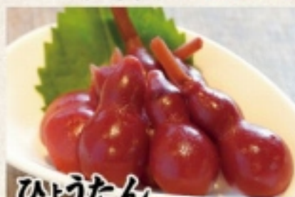
ひょうたんしば漬け 500円