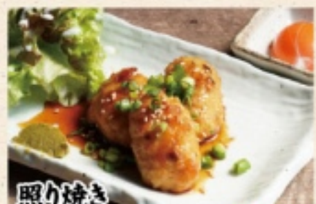
照り焼き 月見つくね