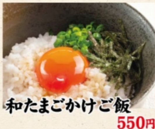
和たまごかけご飯 550円