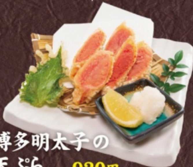
博多明太子の 天ぷら 930円