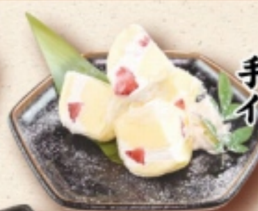
手作りアイス イチゴ大福 680円