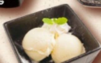
練乳バニラアイス 430円