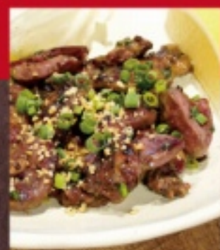
鶏もも・鶏むね ミックス 880円 鶏ハラミ 880円 鶏砂ずり 880円 鶏ハツ 880円